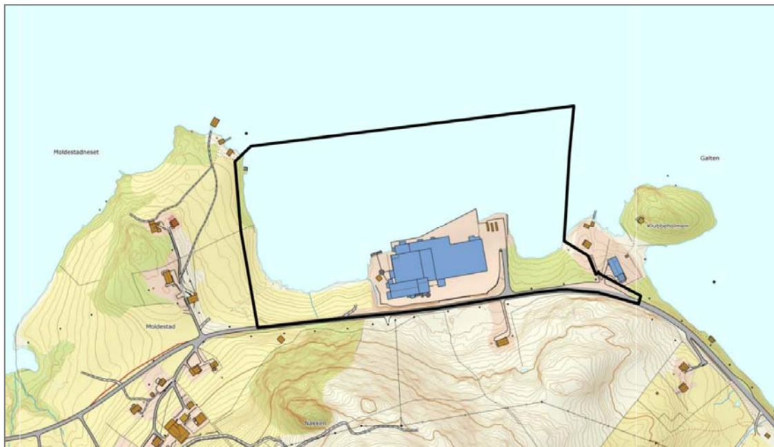
Figur 1 Kart som syner lokalisering og avgrensing av planframlegget (markert med svart linje). Kart henta frå Fylkesatlas.

Planområdet: Er på om lag 115 daa og er lokalisert på sørsida av Moldefjorden, aust for Salt og Moldestadneset. Området omfattar mellom anna gbnr. 70/17-18, 70/26 og delar av 70/2. Det er ca. 10 km køyreveg frå Pelagia til Selje sentrum.