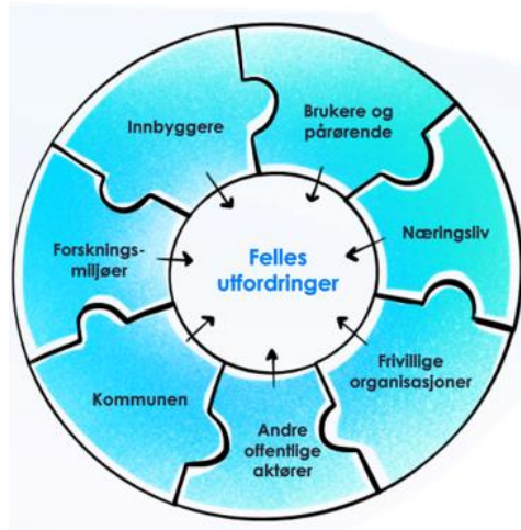
Figur 2: Samskaping for å løyse felles utfordringar.

Samskaping krev nytenking. Vi må sjå utover kommunen som organisasjon. Ved å mobilisere ressursane i lokalsamfunnet kan vi skape gode liv i vår kommune. For å oppnå eit godt samfunn og gode tenester må dei ulike einingane i organisasjonen arbeide saman, på tvers av fagområde.