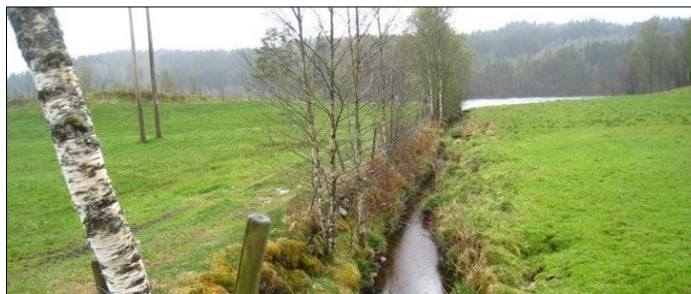
Kantvegetasjon i Njåstadelva.