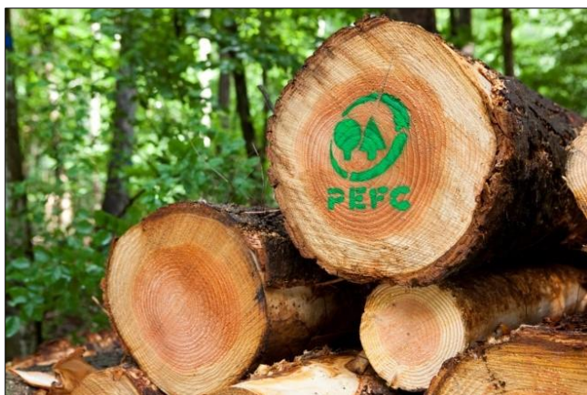
PEFC-sertifisert tømmer er berekraftig.

I vinter har det vore gjennomført PEFC-kurs ulike stadar i Nordfjord. Skal du hogge og levere tømmer sjølv til tømmerkjøpar, må du vere PEFC-sertifisert. PEFC er dokumentasjon på at tømmeret kjem frå ein skog som vert forvalta og hogd på ein berekraftig måte.