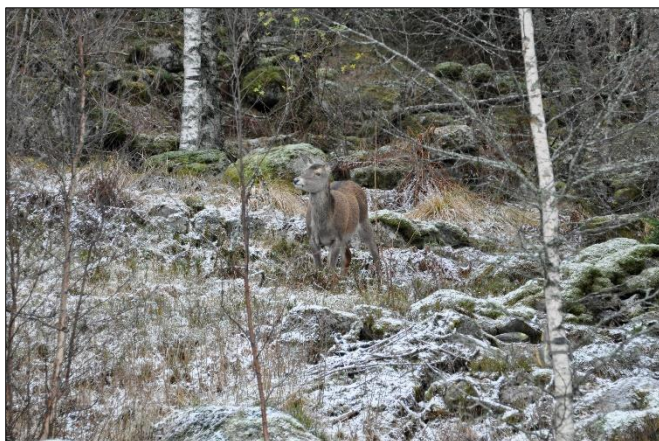
Hjort i vinterlandskap.

I Stad kommune har forskrift om jakt etter hjort og minstearealet vore ute på høyring. Etter ei vurdering av høyringsinnspela er det lagt fram eit forslag om å endre minstearealet til seks vald rundt Moldefjorden og omegn. Den overordna planen for hjorteforvaltning for perioden 2024-2026 i både Stad og Gloppen kommune har og vore ute på høyring. Dei tre sakene vert handsama på kvart sitt Samfunnsutval den 28. februar og sakene i Stad skal handsamast av kommunestyret 7. mars.