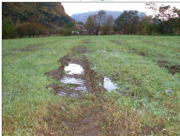
Slik kan det bli om ein ikkje drenerar.