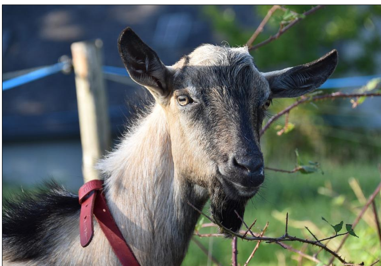
Geita er ein god landskapspleiar.

Tiltak for å stimulere til auka beitebruk i utmark. Faste installasjonar som bruer og skiljeanlegg, sperregjerde og elektronisk sporingsutstyr vert prioritert.