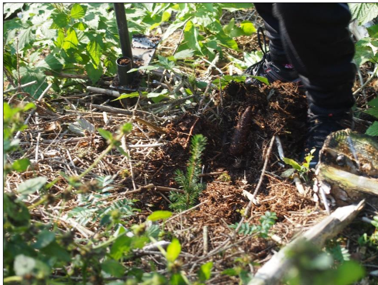
Ny granplante som skal vekse i mange tiår.

I dag vert altfor lite av avverkingsarealet forynga etter hogst og det er viktig både for framtidig verdiskaping og omsynet til klimaarbeidet at skogressursane vert forvalta godt. Vidare er det viktig at skogeigar driv ungskogpleie for å auke tilvekst, kvalitet og redusere risiko for skadar ved storm. Skogeigar får tilskot til både planting og ungskogpleie. Ta kontakt med kommunen om du har spørsmål rundt desse ordningane. Sjå også retningslinjene for tilskot lenger ned.