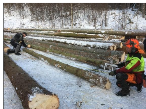
Praktisk opplæring på kappedag.