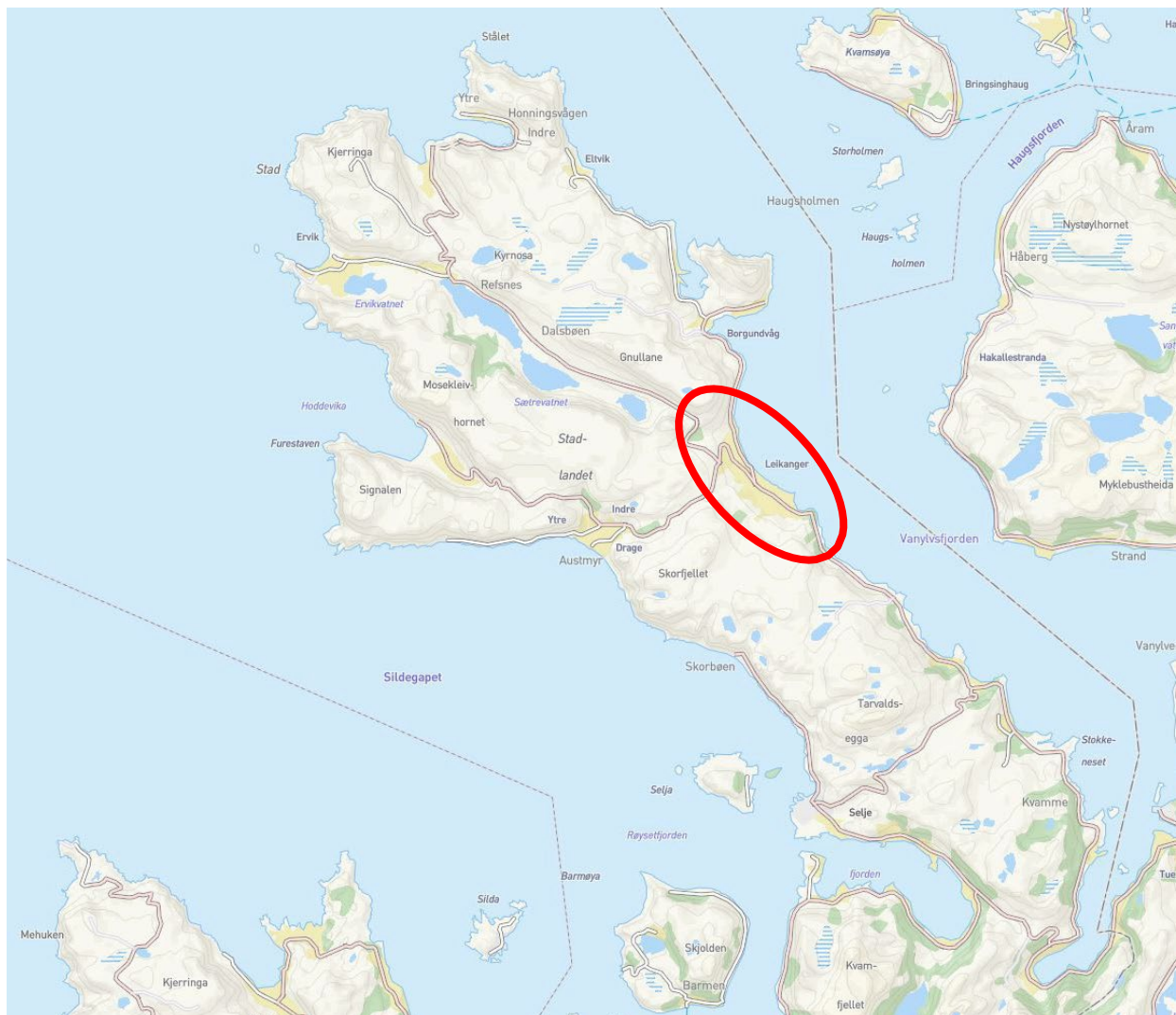
Figur 1: Leikanger i Stad kommune.

Med heimel i plan- og bygningsloven (pbl.) §§ 12-1 og 12-8 blir det varsla oppstart av reguleringsplanarbeid for etablering av indre hamn med ein molo ved Leikanger på Stadlandet. Planen vil utarbeidast som detaljreguleringsplan, jf. pbl. § 12-3.