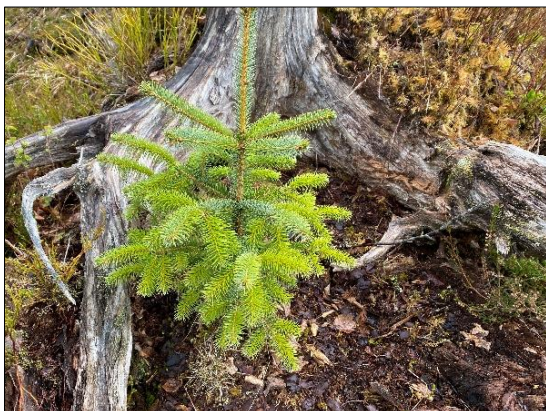
Granplante i god vekst.

Det kan vere gode grunnar til å plante skog på areal der det tidlegare ikkje har vore planta skog før. Dette kan små teigar av til dømes innmarksbeite som ikkje har nytte lenger eller som av ulike orsakar har vekse til.