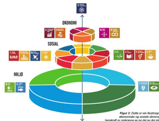
Figur 2: Dette er ein illustrasjon på at dei økonomiske og sosiale dimensjonane ved berekraft er omkransa av og del av dei miljømessige.

Meldingar til Stortinget syner prioriterte politikkområde på nasjonalt nivå. Tema som har vore tatt opp dei siste fire åra er mellom anna: tidleg innsats i oppveksten, distrikt, fiskerinæring, folkehelse, helsenæringa, ulikskap og låg inntekt, frivillig innsats i samfunnet, kultur, kvalitet i livet som eldre, IKT-tryggleik, FN sine berekraftsmål, reiseliv, berekraftige byar og sterke distrikt, samfunnstryggleik, digital agenda, naturmangfald og likestilling.