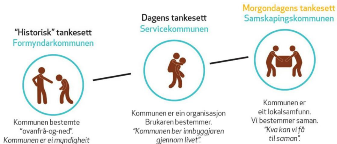
Figur 4: Vegen til samskapingskommunen 8

Samskaping krev nytenking. Vi må sjå utover kommunen som organisasjon. Ved å mobilisere ressursane i lokalsamfunnet kan vi skape gode liv i vår kommune.