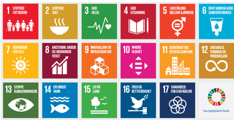
Figur 1: FN sine berekraftmål 1

FN sine berekraftmål skal også i Noreg vere hovudsporet for å ta tak i dei største utfordringane i vår tid. Regjeringa vil utvikle indikatorar for berekraftmåla, slik at effekten av kommunane sin eigen innsats i dette arbeidet mot felles mål kan målast.